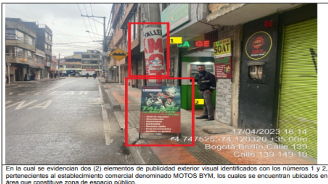
En la cual se evidencian dos (2) elementos de publicidad exterior visual identificados con los números 1 y 2, pertenecientes al establecimiento comercial denominado MOTOS BYM, los cuales se encuentran ubicados en área que constituye zona de espacio público.